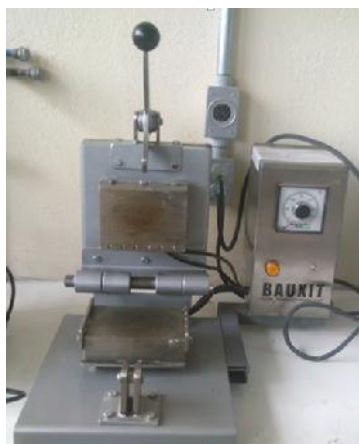
Fig. 1. Prensa de termoformado para la elaboración de espumas solidas

En las concentraciones adecuadas, se mezclaron los ingredientes, utilizando una batidora de mano (marca Sunbeam) durante 3 minutos, hasta que se obtuvo una mezcla homogénea, la mezcla resultante, se colocó en una prensa de termoformado de fabricación personal, (Figura 1) a una temperatura de 180°C durante 10 minutos, tiempo necesario para que la mezcla se seque y se gelatinizará el almidón, lo cual proporciona propiedades físicas similares al poliestireno