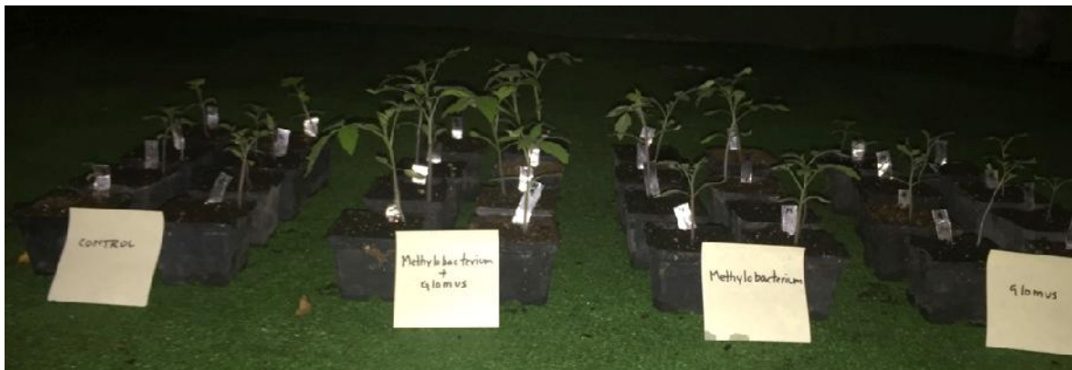
Figura 1. Efecto de la presencia del consorcio Methylobacterium + glomus en el desarrollo de plantas de jitomate. C = control, M+G = Methylobacterium + Glomus , M = Methylobacterium y G = Glomus .

Para determinar si el consorcio de Methylobacterium y Glomus actuaban sinérgicamente para incrementar la germinación y el desarrollo vegetal de L. esculentum var verome, se contrastó contra Methylobacterium del cual ya han sido bien demostrados sus efectos en la germinación y desarrollo vegetal (Ryu y col. 2006) y Glomus del cual productores recomiendan recubrir las semillas con este mismo fin (comunicación personal). Todos los tratamientos presentaron diferencias estadísticamente significativas, sin embargo, el grado de estimulación del consorcio Methylobacterium y Glomus mostró una diferencia estadísticamente significativa respecto a los demás tratamientos ( tabla 1 ), evidenciando una articulación conjunta benéfica por la acción de la bacteria en la parte aérea de la planta y el hongo en el rizoma ( Figura 1 ). De igual manera, las inoculaciones realizadas en los tratamientos \text{Tr}_1 y \text{Tr}_2 presentaron un incremento estadísticamente significativo en R_G y en el SVI con respecto al control sin microorganismos \text{Tr}_4 y al tratamiento donde se aplicó únicamente Glomus \text{Tr}_3 ( Tabla 1 )